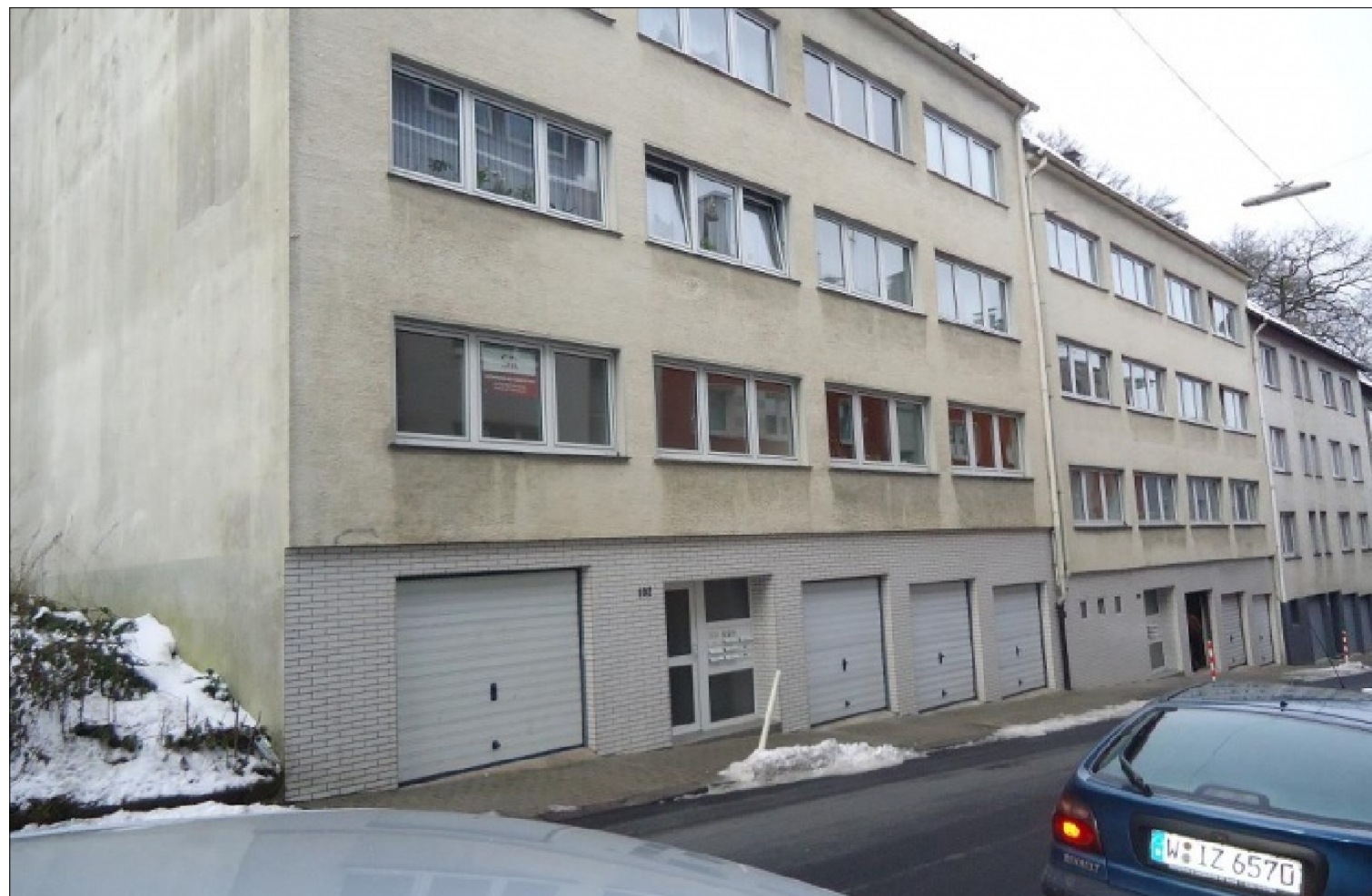
Zusatzbild für Galerie

Mieterprovision EUR: 1 Kaltmiete exkl. MwSt.