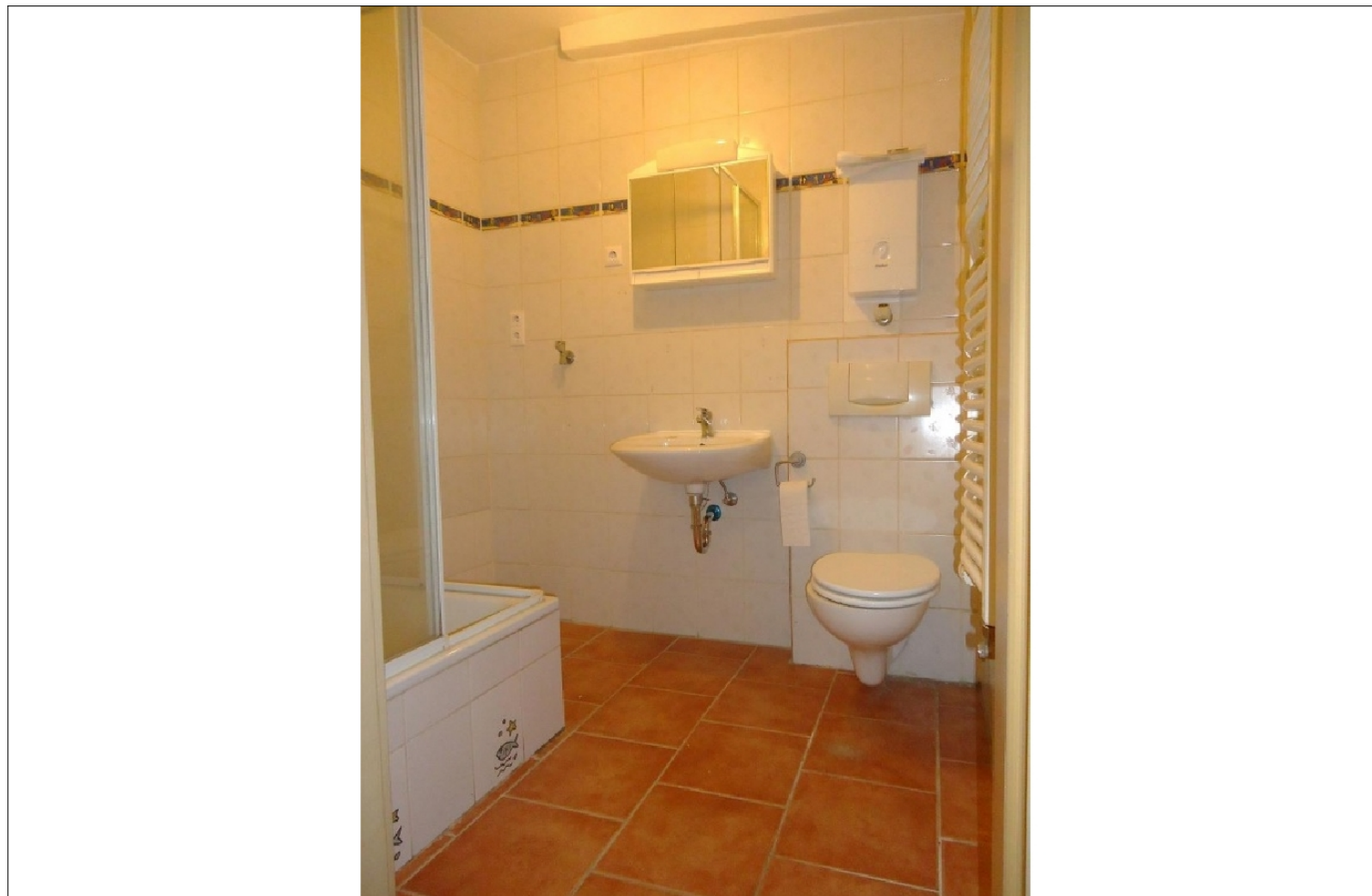
Zusatzbild für Galerie

Mieterprovision EUR: 1 Kaltmiete exkl. MwSt.