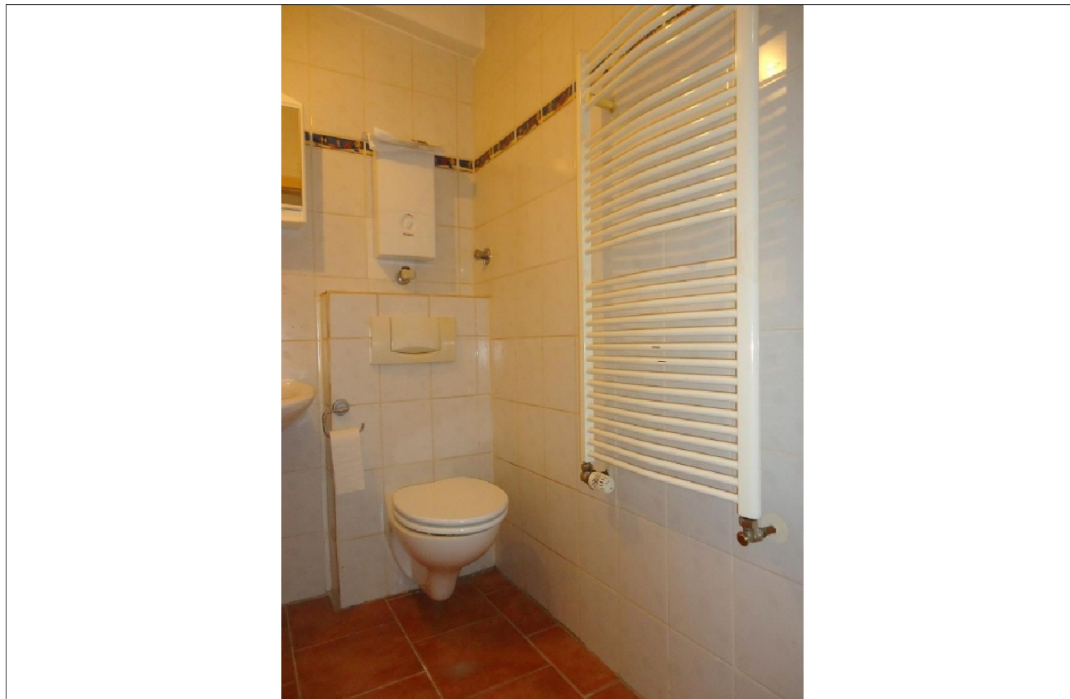
Zusatzbild für Galerie

Mieterprovision EUR: 1 Kaltmiete exkl. MwSt.