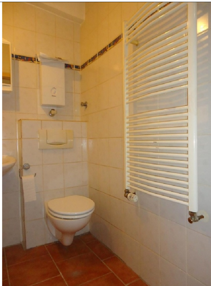
Zusatzbild für Galerie

Mieterprovision EUR: 1 Kaltmiete exkl. MwSt.